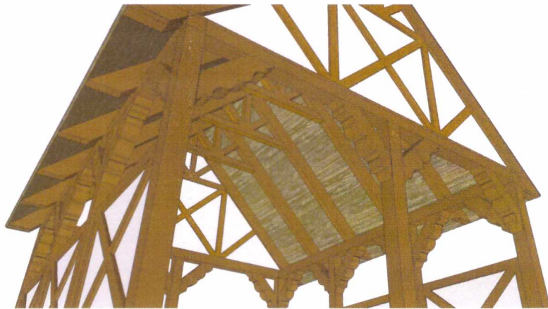
WIDOK NA WIEŻBĘ DACHOWĄ