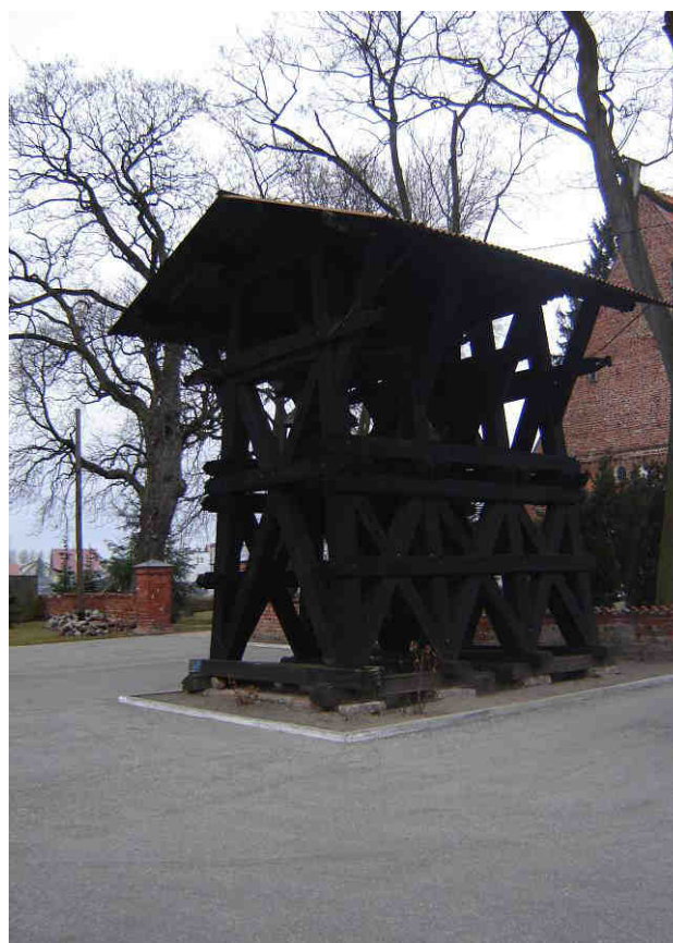
Dzwonnica przy Kościele Parafialnym w Krzyżanowie