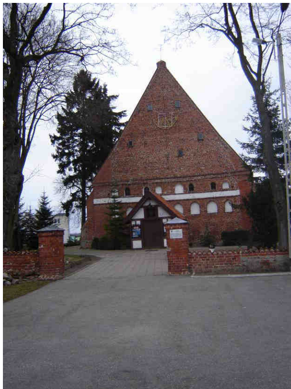
Kościół Parafialny p.w. św. Barbary w Krzyżanowie

Do Gminnej Ewidencji Zabytków wpisane są 32 obiekty. Oprócz wyżej wymienionych zabytków znalazły się tam m.in. organistówka, budynek mieszkalny tzw. Gutshause, wozownia i budynek szkoły parafialnej.