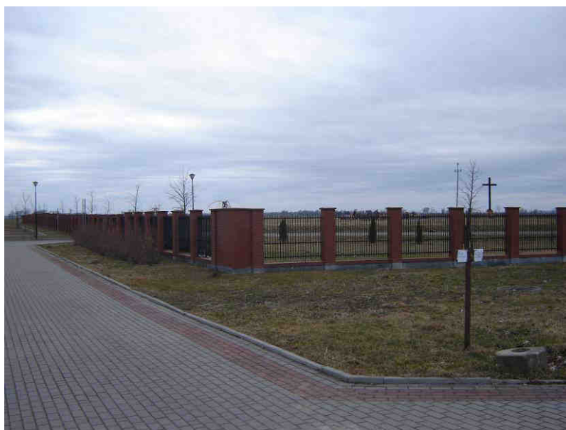
Cmentarz komunalny w Krzyżanowie

We wsi Krzyżanowo znajduje się również założony w 2008 r. cmentarz komunalny.