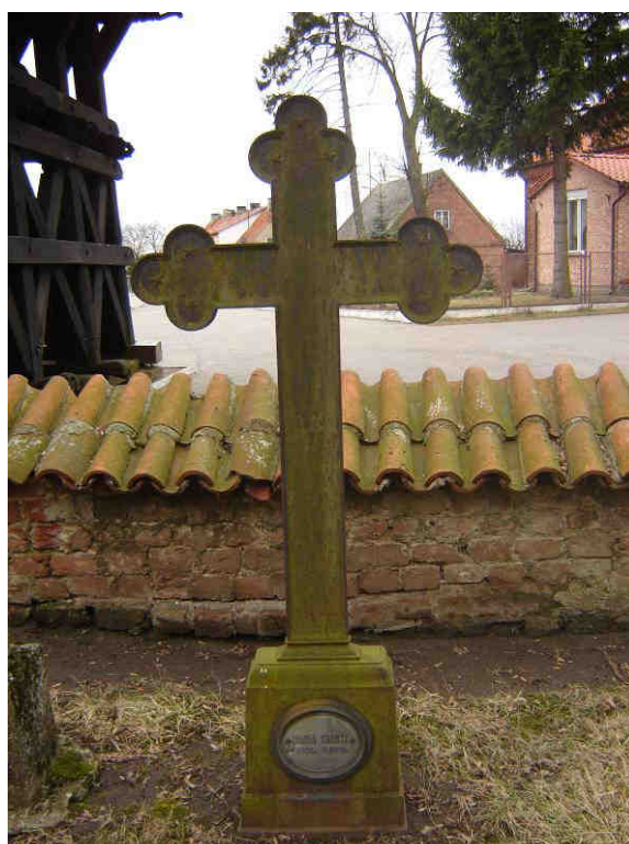
Neogotycki krzyż z XIX wieku