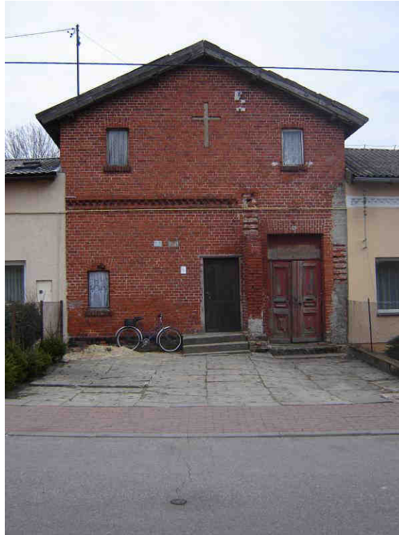
Szkoła parafialna z drugiej połowy XIX wieku.

Krzyżanowo około roku 1319. Niemiecka nazwa wsi Notzendorf pochodziła od nazwiska bogatego właściciela ziemskiego (bauera) Nocze. Krzyżanowo stanowiło główny ośrodek religijny dla okolicznej ludności wyznania katolickiego. W 1330 r. mieszkańcy sąsiedniej wsi Stare Pole zostali zobowiązani do płacenia dziesięciny dla kościoła w Krzyżanowie. W 1408 r. to w Krzyżanowie powstała pierwsza w okolicy szkoła parafialna. Szkoła ta funkcjonowała do 1934 roku w budynku z XIX w.