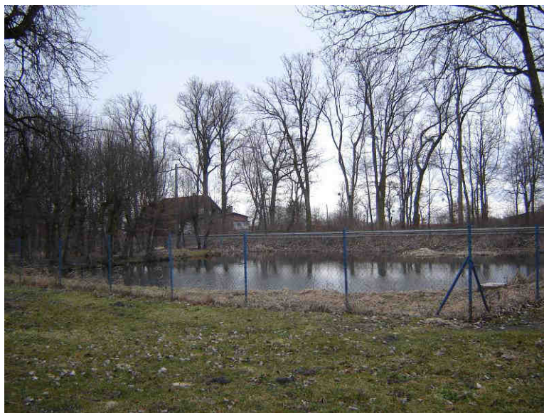
Zbiornik wodny w parku wiejskim

Miejszem rekreacyjno – wypoczynkowym we wsi Krzyżanowo jest park wiejski, założony w XIX wieku. Oprócz historycznych nasadzeń jesionów, klonów, dębów i lip, w parku znajduje się również plac zabaw dla dzieci oraz zbiornik wodny (dawny basen przeciwpożarowy).