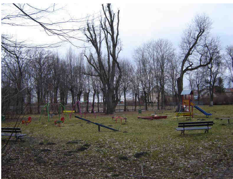
Pomnik przyrody w parku wiejskim – dąb szypułkowy