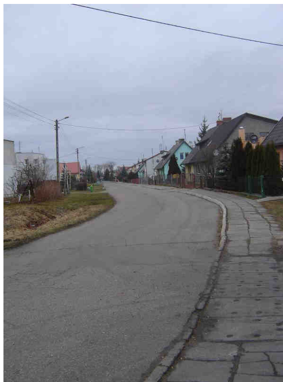
Droga gminna w kierunku Starego Pola wraz z zabudową mieszkaniową (z prawej strony dawne domki dla robotników)