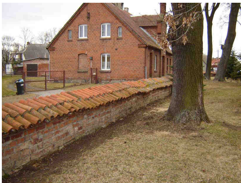
Mur cmentarny z końca XV wieku. W tle organistówka – budynek z końca XIX wieku

Arkusze planowania w sposób przejrzysty przedstawia priorytet rozwoju miejscowości Krzyżanowo, z wyodrębnionymi celami i projektami służącymi do jego realizacji. Część z nich wykracza poza zakres zadań realizowanych w ramach odnowy wsi.