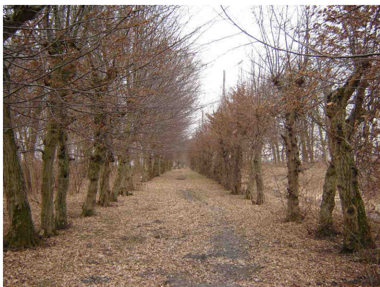
XIX-wieczny park wiejski – aleja z grabów

Drugą kompozycja zieleni wysokiej zachowała się po zachodniej stronie drogi do Dzierzgonia, przy siedliskach domów nr 2 i nr 4. Występują tu nasadzenia graniczne z lip i jesionów od strony zachodniej i południowej, przy budynku nr 4 grupa jesionów i dębów, z których jeden stanowi pomnik przyrody. Obecnie teren (własność Skarbu Państwa w zarządzie Agencji Nieruchomości Rolnych) jest nieuporządkowany i zarośnięty samosiewami.