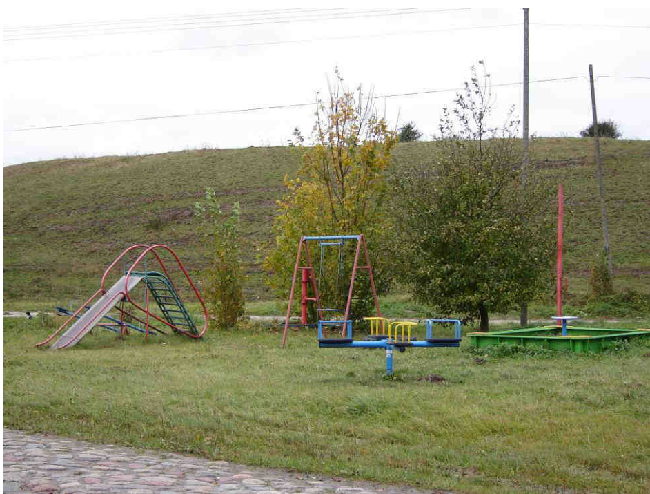
Plac zabaw przy świetlicy wiejskiej

Mieszkańcy chcą aby rozwój ich miejscowości zmierzał w kierunku urzeczywistnienia wyżej przedstawionej wizji. Z uwagi na fakt, że jest miejscowością o dużym potencjale turystycznym ma być wsią zadbaną i estetyczną.