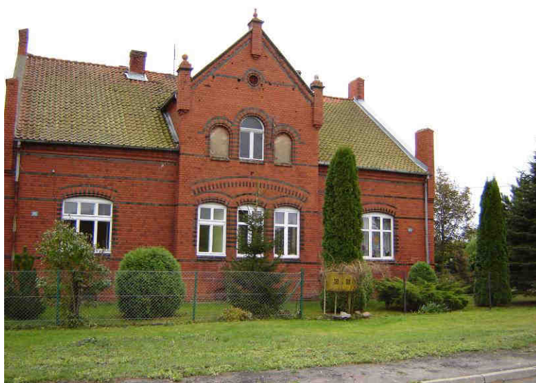
Budynek mieszkalny z 1902 r.

zieleni wysokiej, komponowanej to: szpaler złożony z sześciu kasztanowców (około 100 letnich) w północno - wschodniej części wsi, wzdłuż drogi wiejskiej. Dawniej zapewne kompozycja zieleni wysokiej – pozostałość parku wiejskiego (zdjęcie z lewej strony).