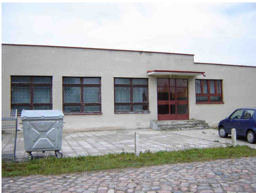
Budynek świetlicy wiejskiej

Mieszkańcy Janówki w zakresie podstawowej opieki zdrowotnej mogą korzystać z usług świadczonych przez Ośrodek Zdrowia Mederi, znajdujący się w Starym Polu. Mieści się on w tym samym budynku co Urząd Gminy. W budynku tym znajduje się również apteka, Gminny Ośrodek Pomocy Społecznej, Posterunek Policji, który dba o bezpieczeństwo publiczne w całej gminie i jedna z jednostek Ochotniczej Straży Pożarnej, która od 1997 r. włączona jest do Krajowego Systemu Ratowniczo-Gaśniczego oraz do selektywnego systemu alarmowania, zlokalizowanego w Państwowej Straży Pożarnej w Malborku