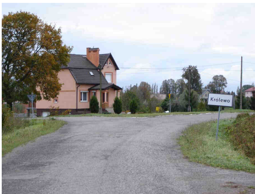
Wjazd do Królewa od strony Janówki