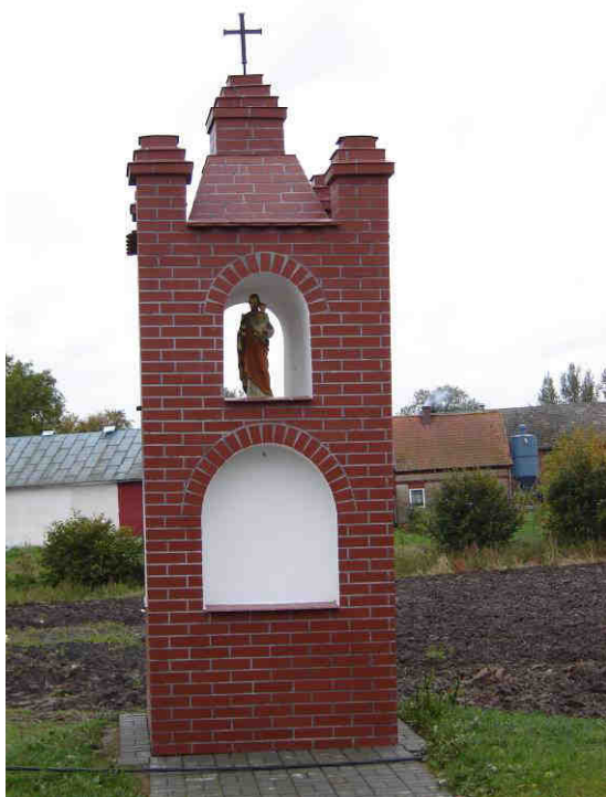
Kapliczka z początku XVI w. Po remoncie w 2000 r. obiekt zatracił cechy stylowe

Arkusze planowania w sposób przejrzysty przedstawia priorytet rozwoju miejscowości Królewo, z wyodrębnionymi celami i projektami służącymi do jego realizacji. Część z nich wykracza poza zakres zadań realizowanych w ramach odnowy wsi.