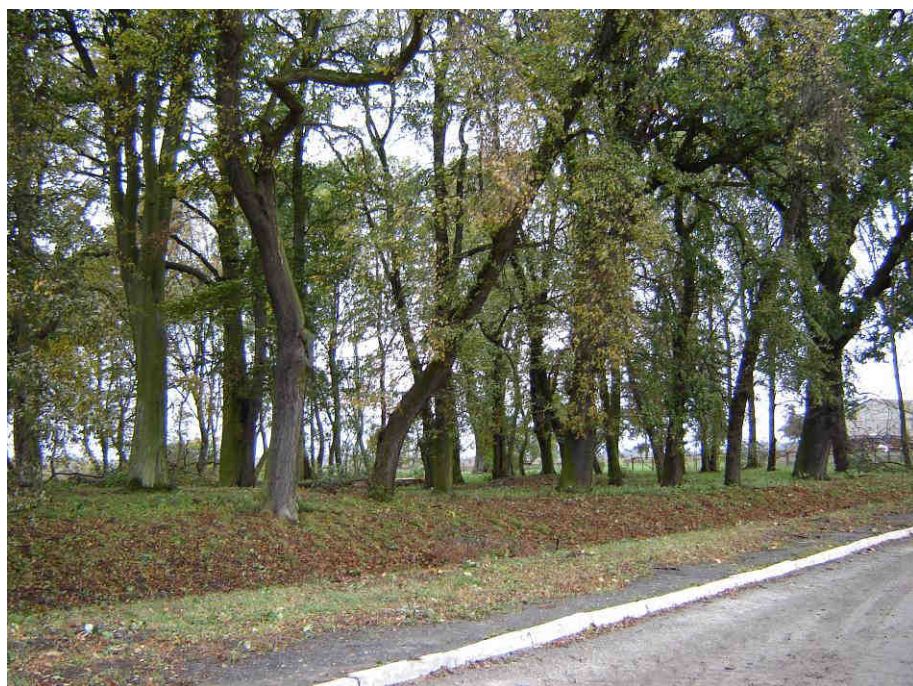
Teren parku wiejskiego – szpaler drzew z połowy XIX w.