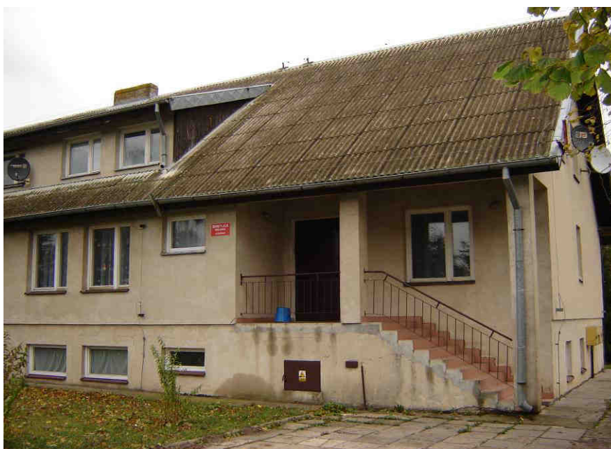
Budynek świetlicy w Królewie

Mieszkańcy Królewa w zakresie podstawowej opieki zdrowotnej mogą korzystać z usług świadczonych przez Ośrodek Zdrowia Mederi, znajdujący się w Starym Polu. Mieści się on w tym samym budynku co Urząd Gminy. W budynku tym znajduje się również apteka, Gminny Ośrodek Pomocy Społecznej, Posterunek Policji, który dba o bezpieczeństwo publiczne w całej gminie i jedna z jednostek Ochotniczej Straży Pożarnej, która od 1997 r. włączona jest do Krajowego Systemu Ratowniczo-Gaśniczego oraz do selektywnego systemu alarmowania zlokalizowanego w Państwowej Straży Pożarnej w Malborku.