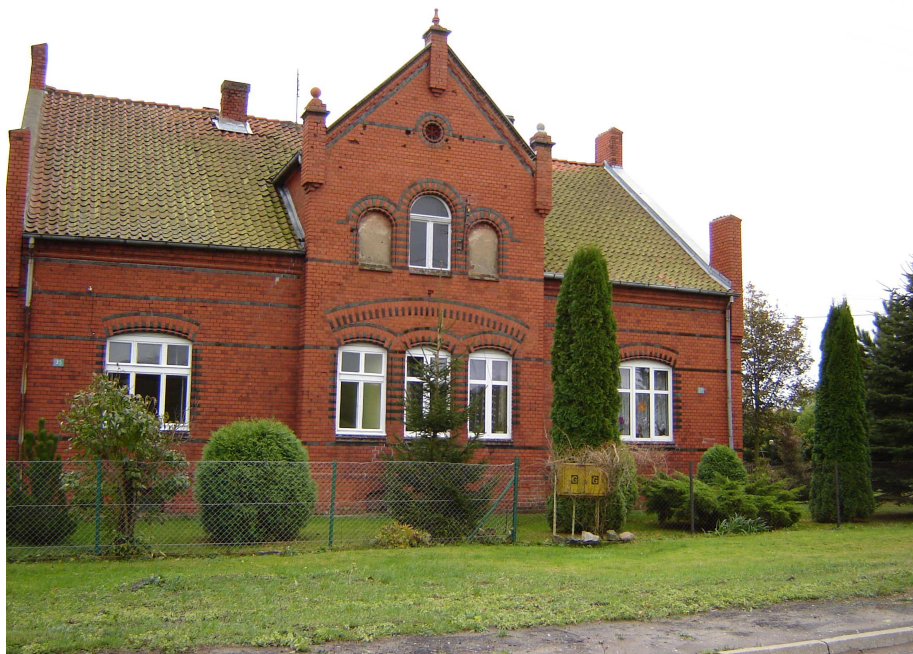
Budynek mieszkalny z 1902 r.

Wyróżniające się elementy zieleni wysokiej, komponowanej to: szpaler złożony z sześciu kasztanowców (około 100 letnich) w północno - wschodniej części wsi, wzdłuż drogi wiejskiej. Dawniej zapewne kompozycja zieleni wysokiej – pozostałość parczku wiejskiego.