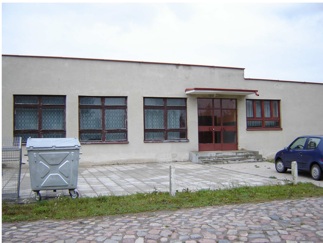
Budynek świetlicy wiejskiej

Usytuowanie gminy z dala od ośrodków wielkiego przemysłu sprawia, że środowisko naturalne jest nie skażone i sprzyja rozwojowi rekreacji oraz aktywnego wypoczynku. Z uwagi na bliskie sąsiedztwo takich ośrodków, jak Malbork, Elbląg, Frombork, Kwidzyn oraz bogatych krajobrazowo i kulturowo obszarów (Żuławy, Wysoczyzna Elbląska, Mierzeja Wiślana, dolina Wisły) istnieje tu możliwość rozwoju turystyki krajoznawczej. Gmina posiada tereny łowieckie zasobne w zwierzynę oraz korzystne warunki dla rozwoju agroturystyki i eko-turystyki, sportów wodnych i wycieczkowych, ma również dogodne położenie przy trasie żeglownej, łączącej Szlak Noteci i Wisły z Kaliningradem.