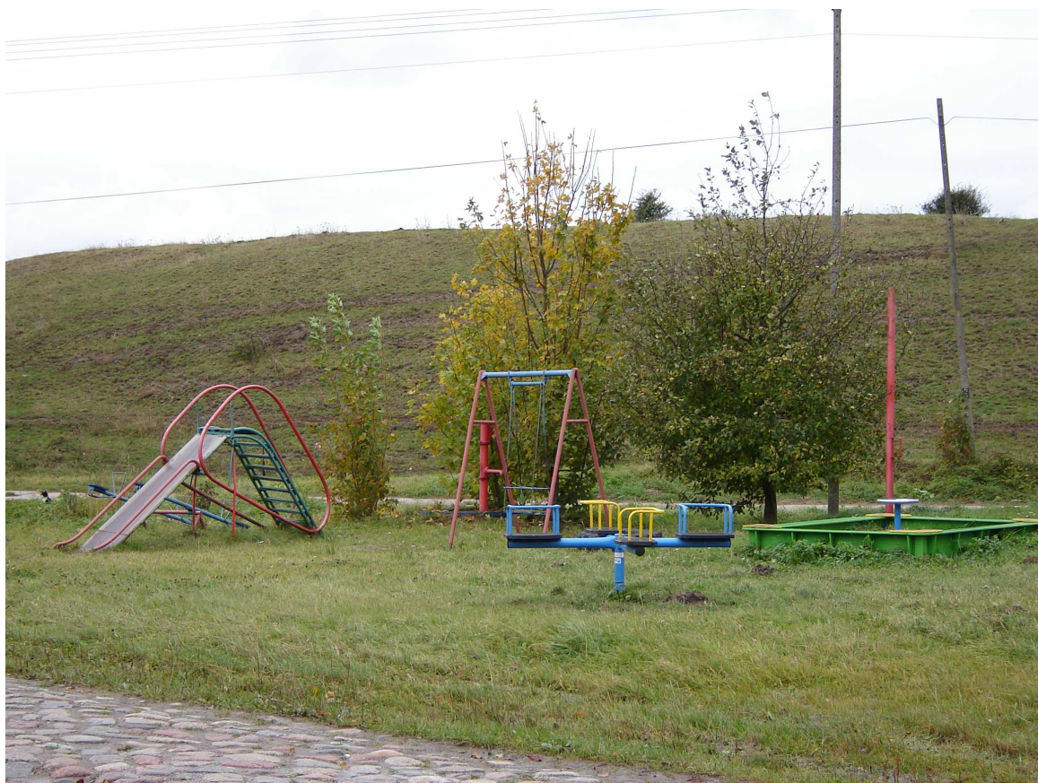
Plac zabaw przy świetlicy wiejskiej

Mieszkańcy chcą aby rozwój ich miejscowości zmierzał w kierunku urzeczywistnienia wyżej przedstawionej wizji. Z uwagi na fakt, że jest miejscowością o dużym potencjale turystycznym ma być wsią zadbaną i estetyczną.