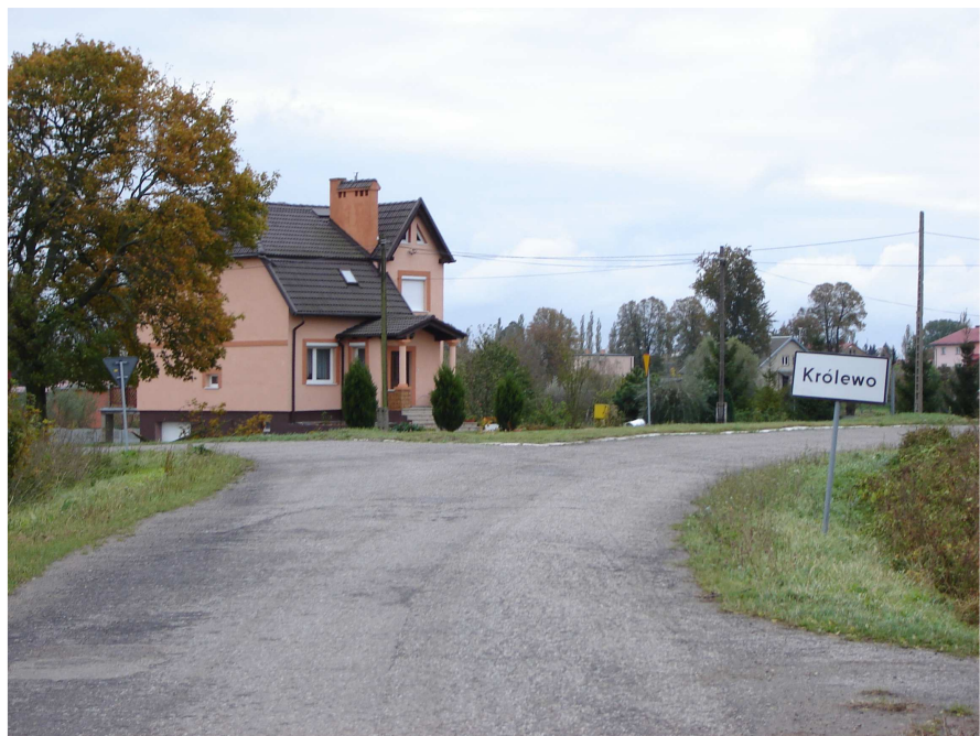
Wjazd do Królewa od strony Janówki