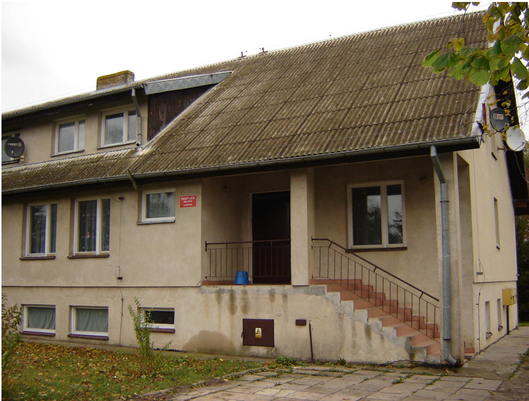
Budynek świetlicy w Królewie.

Usytuowanie gminy z dala od ośrodków wielkiego przemysłu sprawia, że środowisko naturalne jest nie skażone i sprzyja rozwojowi rekreacji oraz aktywnego wypoczynku. Z uwagi na bliskie sąsiedztwo takich ośrodków, jak Malbork, Elbląg, Frombork, Kwidzyn oraz bogatych krajobrazowo i kulturowo obszarów (Żuławy, Wysoczyzna Elbląska, Mierzeja Wiślana, dolina Wisły) istnieje tu możliwość rozwoju turystyki krajoznawczej. Gmina posiada tereny łowieckie zasobne w zwierzynę oraz korzystne warunki dla rozwoju agroturystyki i eko-turystyki, sportów wodnych i wycieczkowych, ma również dogodne położenie przy trasie żeglownej, łączącej Szlak Noteci i Wisły z Kaliningradem.