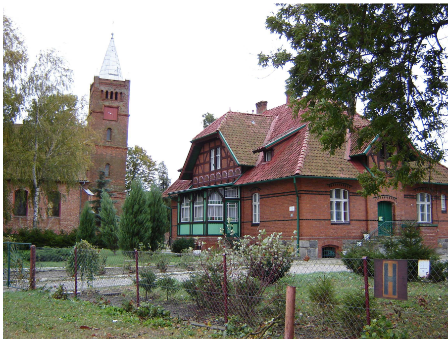
Plebania z ok. 1890 r.

Kościół w Królewie z charakterystyczną krzywą wieżą, wzniesiony w 1820 r. na miejscu starszej, gotyckiej świątyni, rozebranej ze względu na zły stan techniczny w roku 1816. Wieżę dobudowano w 1844 r.