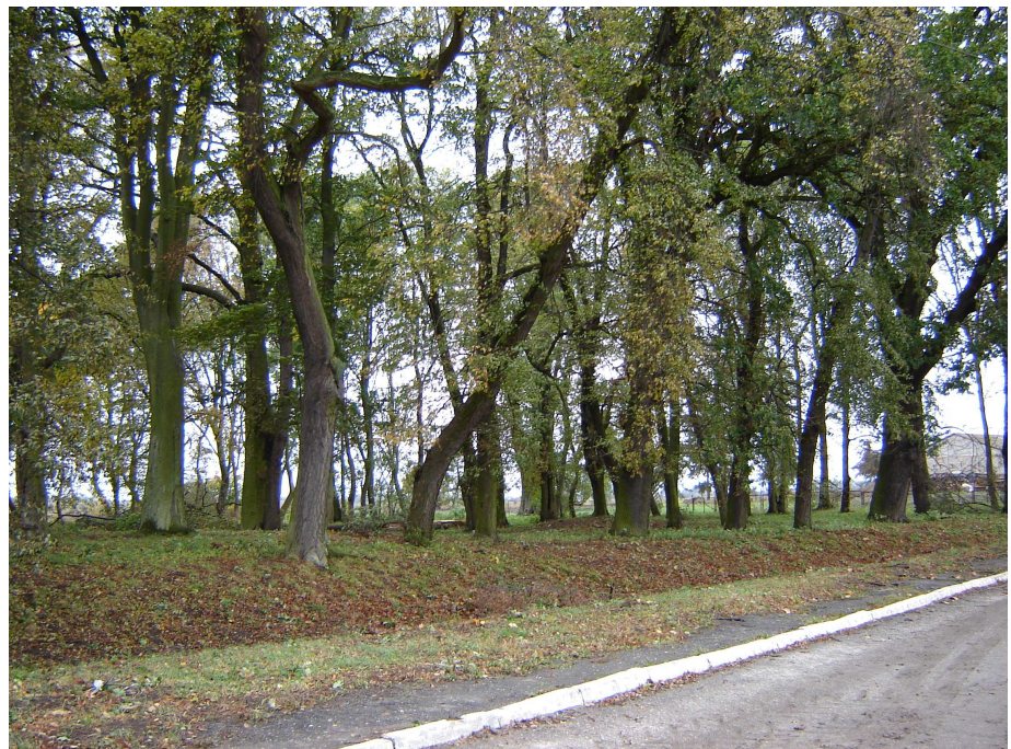
Teren parku wiejskiego – szpaler drzew z połowy XIX w.