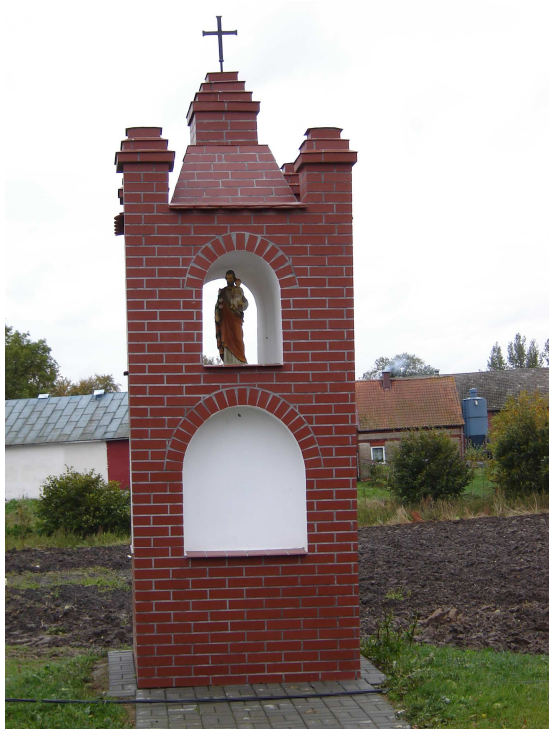
Kapliczka z początku XVI w. Po remoncie w 2000 r. obiekt zatracił cechy stylowe

Arkusze planowania w sposób przejrzysty przedstawia priorytet rozwoju miejscowości Królewo, z wyodrębnionymi celami i projektami służącymi do jego realizacji. Część z nich wykracza poza zakres zadań realizowanych w ramach odnowy wsi.