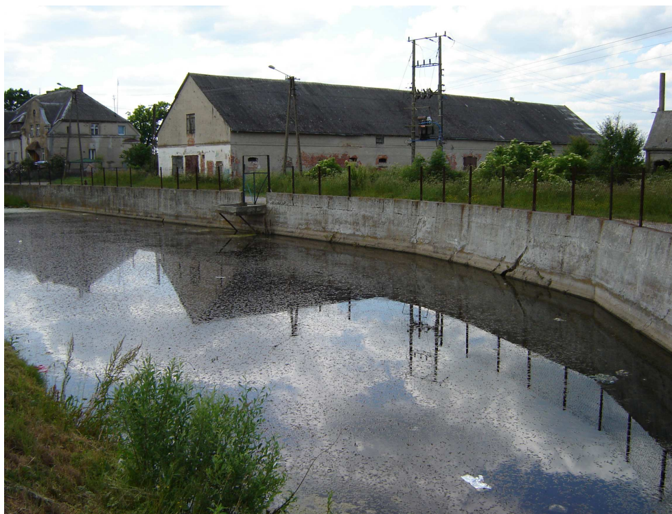
Basen przeciwpożarowy w Kraszewie