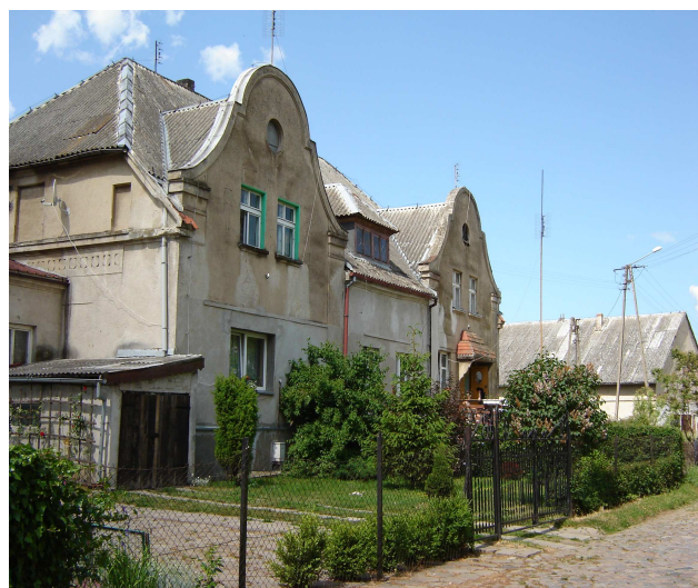
Zabudowania pałacowo-dworskie w Kraszewie