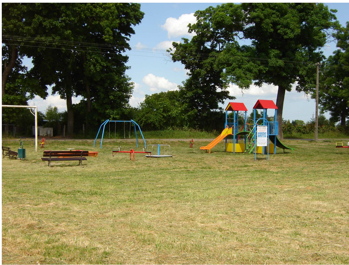
Plac zabaw w Kraszewie

Mieszkańcy chcą aby rozwój ich miejscowości zmierzał w kierunku urzeczywistnienia wyżej przedstawionej wizji. Z uwagi na fakt, że pełni ona głównie funkcję mieszkalną ma być wsią zadbaną i estetyczną.