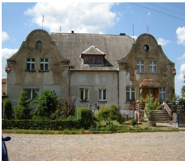
W tym budynku mieściła się świetlica i sklep, które zostały przekształcone w mieszkania

zmodernizowany (nowe pokrycie dachowe, przebudowa wnętrza, wymieniona stolarka). Tylko 2 budynki powstały po roku 1945 i są to typowo postpegeerowskie domy wielorodzinne. W centrum wsi znajduje się kilka budynków produkcyjnych czy wartowniczych dawnego zakładu. Teraz są one opuszczone, niszczeją i obniżają estetykę wsi. Wyróżniające są elementy zieleni wysokiej – pozostałości parków wiejskich, w których występują lipy, dęby, jesiony i brzozy.