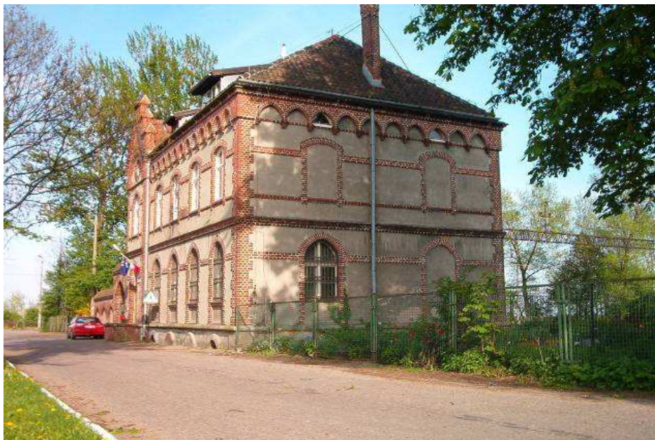
Budynek Urzędu Poczty wraz z oficyną gospodarczą i murowanym ogrodzeniem z XIX w.