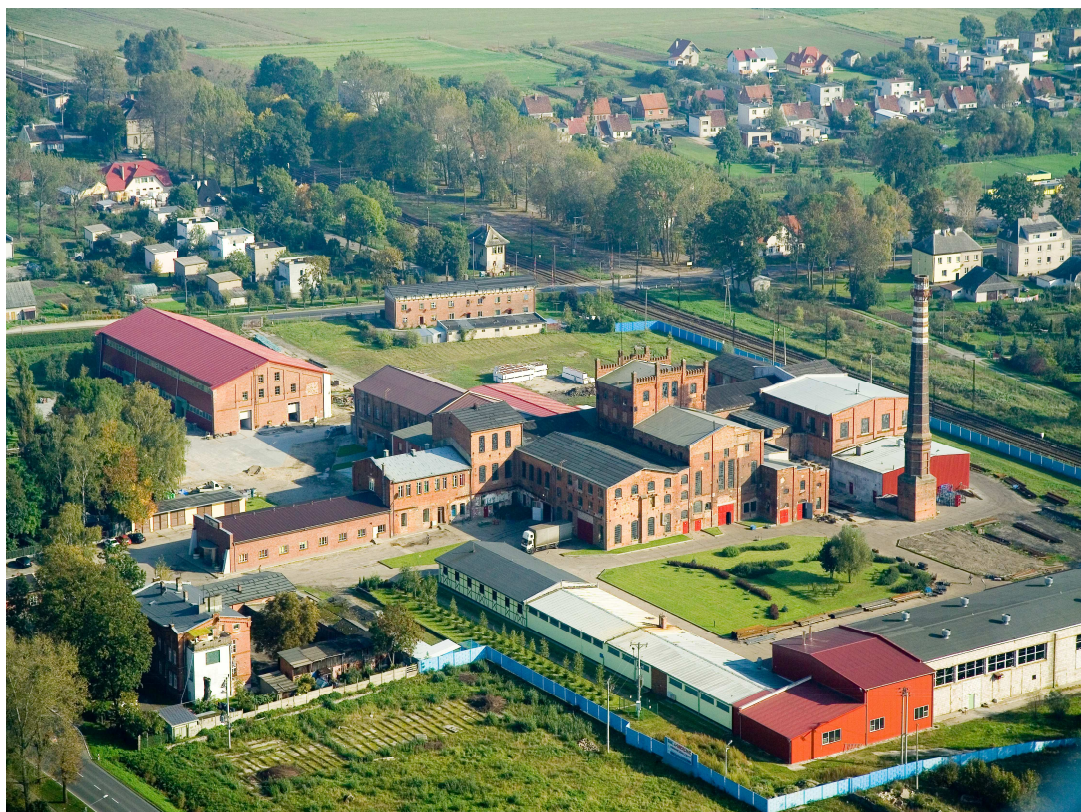
Kompleks budynków produkcyjnych i pomocniczych byłej cukrowni – obecnie siedziba firmy Dam-Rob.

Arkusze planowania w sposób przejrzysty przedstawia priorytet rozwoju miejscowości Stare Pole, z wyodrębnionymi celami i projektami służącymi do jej realizacji. Część z nich wykracza poza zakres zadań realizowanych w ramach odnowy wsi.