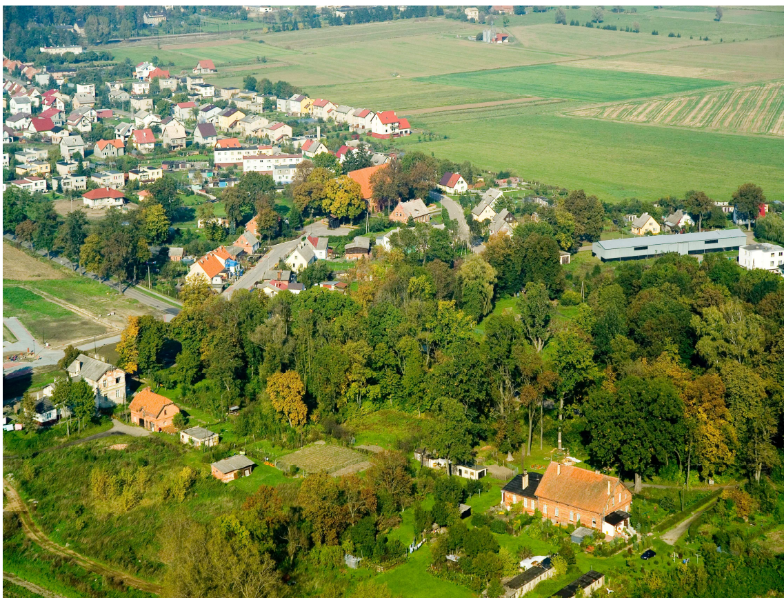
Panorama Starego Pola

„Stare Pole – miejscowość nowoczesna, o wysokim standardzie życia mieszkańców i szerokich możliwościach rozwoju gospodarczego”