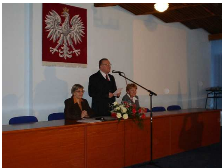
Uroczysta sesja z okazji obchodów 675-lecia Starego Pola