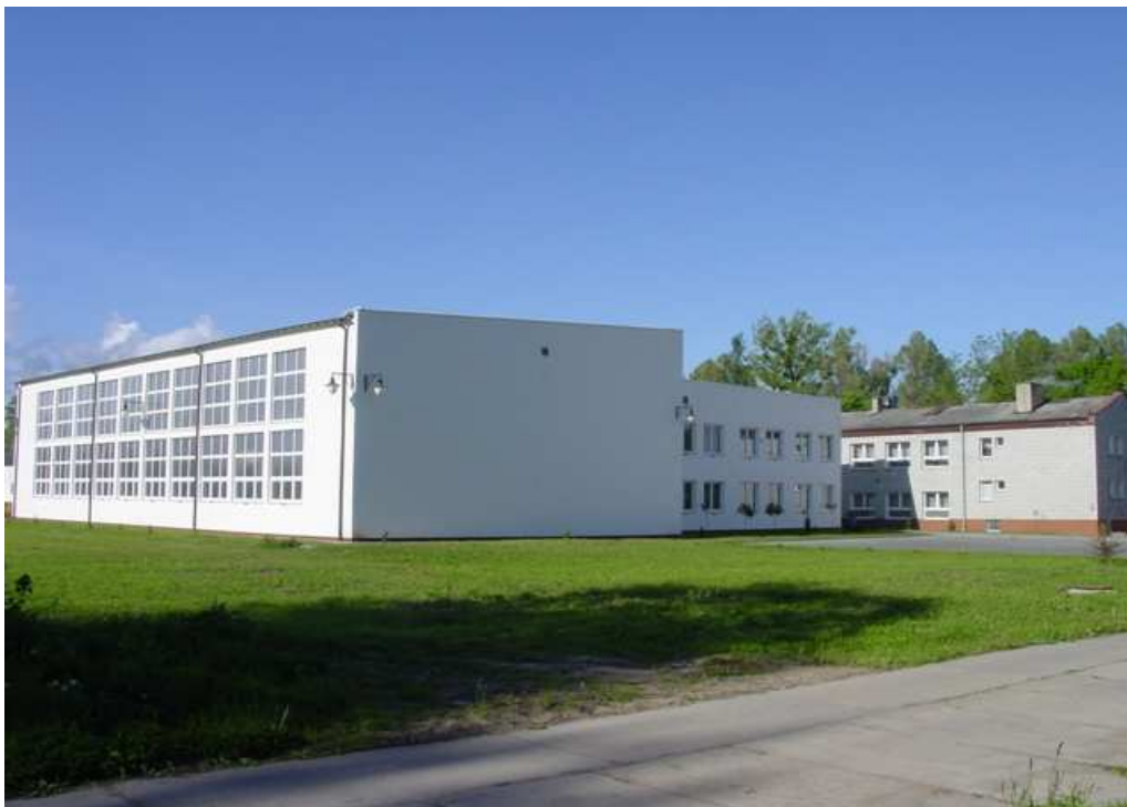
Budynek Zespołu Szkół