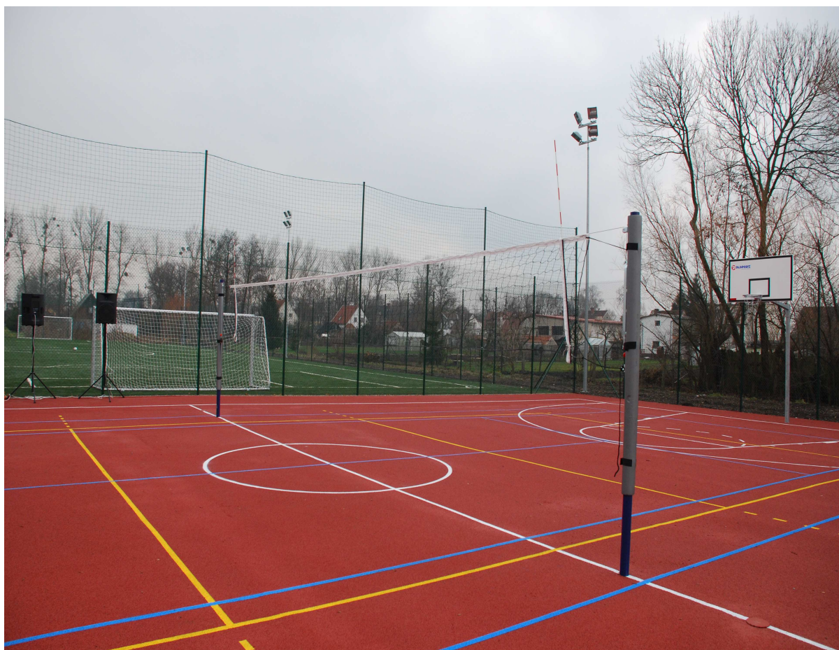
Kompleks sportowy „Moje boisko Orlik 2012”

W roku 2008 gmina stała się również członkiem Stowarzyszenia o nazwie Lokalna Grupa Działania „Spichlerz Żuławski”, które obejmuje obszar powiatu malborskiego. Celem tego Stowarzyszenia jest promocja i wspieranie rozwoju obszarów wiejskich gmin należących do stowarzyszenia oraz aktywizacja lokalnej społeczności.