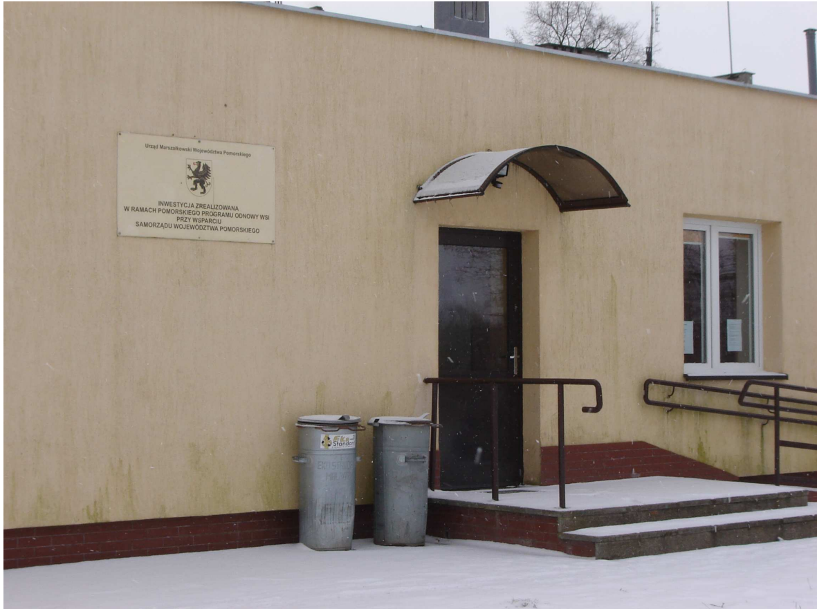
Budynek świetlicy wiejskiej w Ząbrowie wyremontowany w 2006 r. w ramach Pomorskiego Programu Odnowy Wsi.

Arkusze planowania w sposób przejrzysty przedstawia priorytet rozwoju miejscowości Ząbrowo, z wyodrębnionymi celami i projektami służącymi do jego realizacji. Część z nich wykracza poza zakres zadań realizowanych w ramach odnowy wsi.