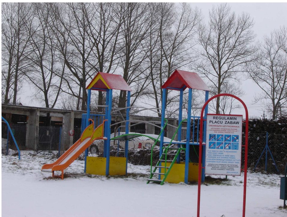
Plac zabaw w miejscowości Ząbrowo

Usytuowanie gminy z dala od ośrodków wielkiego przemysłu sprawia, że środowisko naturalne jest nie skażone i sprzyja rozwojowi rekreacji oraz aktywnego wypoczynku. Z uwagi na bliskie sąsiedztwo takich ośrodków, jak Malbork, Elbląg, Frombork, Kwidzyn oraz bogatych krajobrazowo i kulturowo obszarów (Żuławy, Wysoczyzna Elbląska, Mierzeja Wiślana, dolina Wisły) istnieje tu możliwość rozwoju turystyki krajoznawczej. Gmina posiada tereny łowieckie zasobne w zwierzynę oraz korzystne warunki dla rozwoju agroturystyki i eko-turystyki, sportów wodnych i wyczynowych, ma również dogodne położenie przy trasie żeglownej, łączącej Szlak Noteci i Wisły z Kaliningradem.