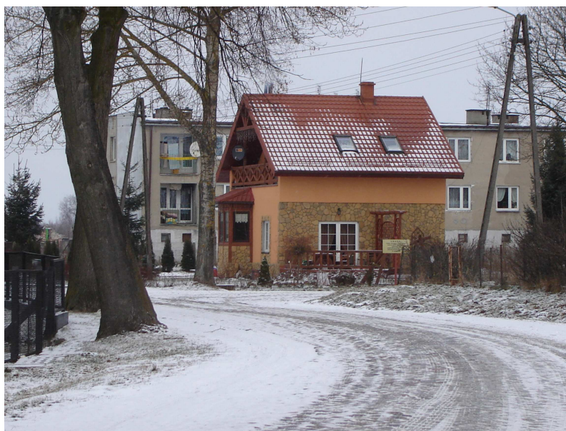
Dom mieszkalny powstały z byłego punktu skupu mleka

„Ząbrowo – wieś estetyczna, o wysokim standardzie życia mieszkańców, pielęgnujących tradycyjne wartości, z rozwiniętymi formami przedsiębiorczości wiejskiej”.