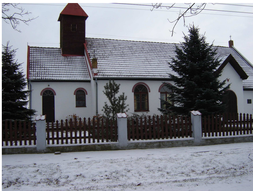
Kaplica w Ząbrowie