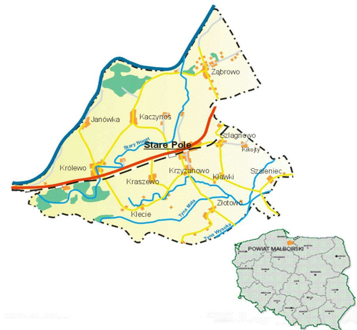
Rysunek 2: Położenie Gminy w kontekście regionalnym

W przeliczeniu na 1 km 2 przypada 58 osób.