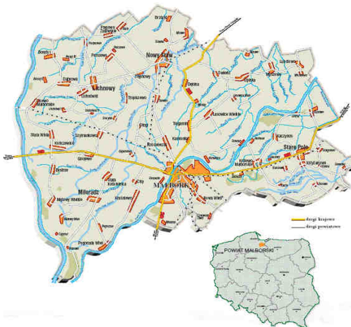
Rysunek 2: Położenie Gminy w kontekście regionalnym

Gmina Stare Pole położona jest na terenie Żuławy Wiślanej przy trasie kolejowej i drogowej Malbork – Elbląg. Administracyjnie Gmina leży na terenie Powiatu Malborskiego w województwie Pomorskim. Gmina obejmuje obszar 79,72 km 2 . Strukturę zagospodarowania przedstawiono w Tabeli poniżej: